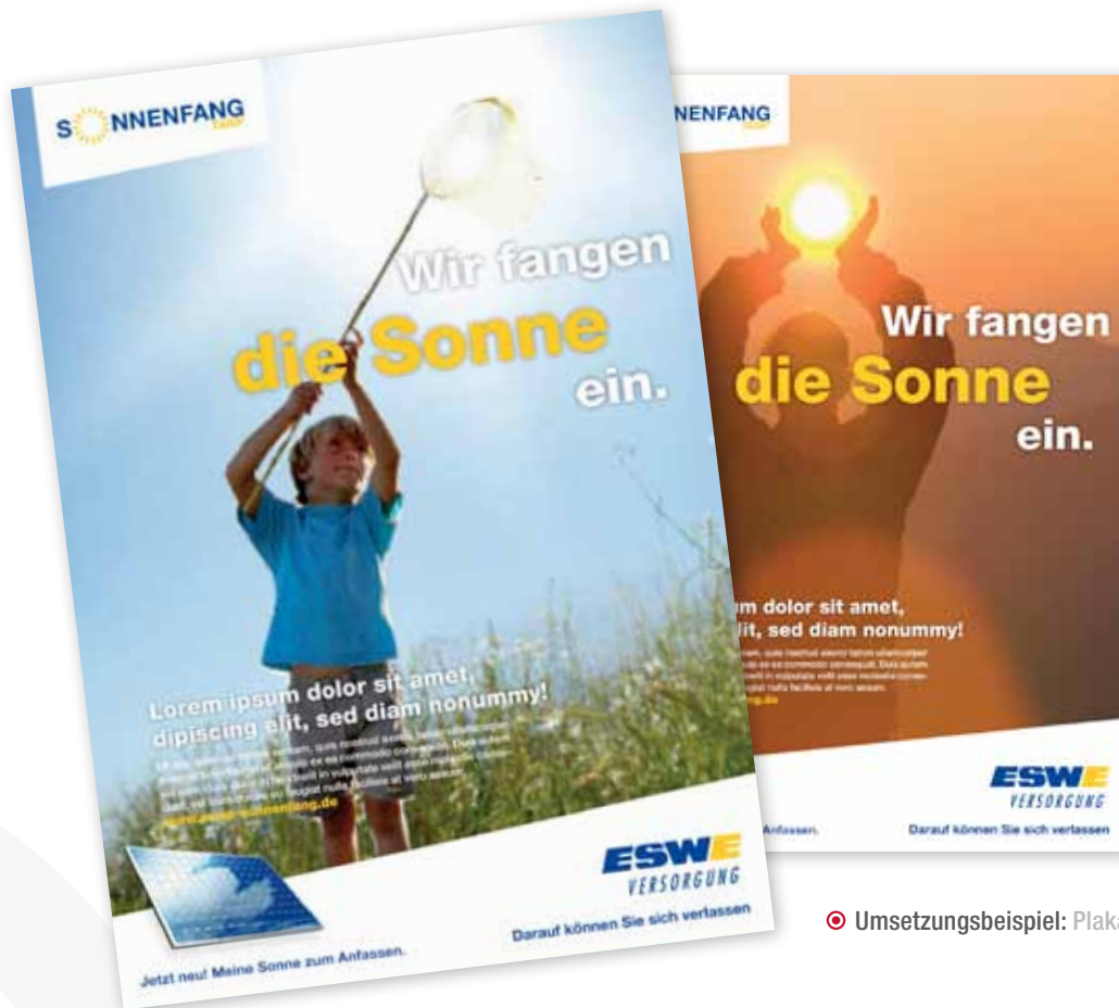
🎯 Umsetzungsbeispiel: Plakate & Anzeigen