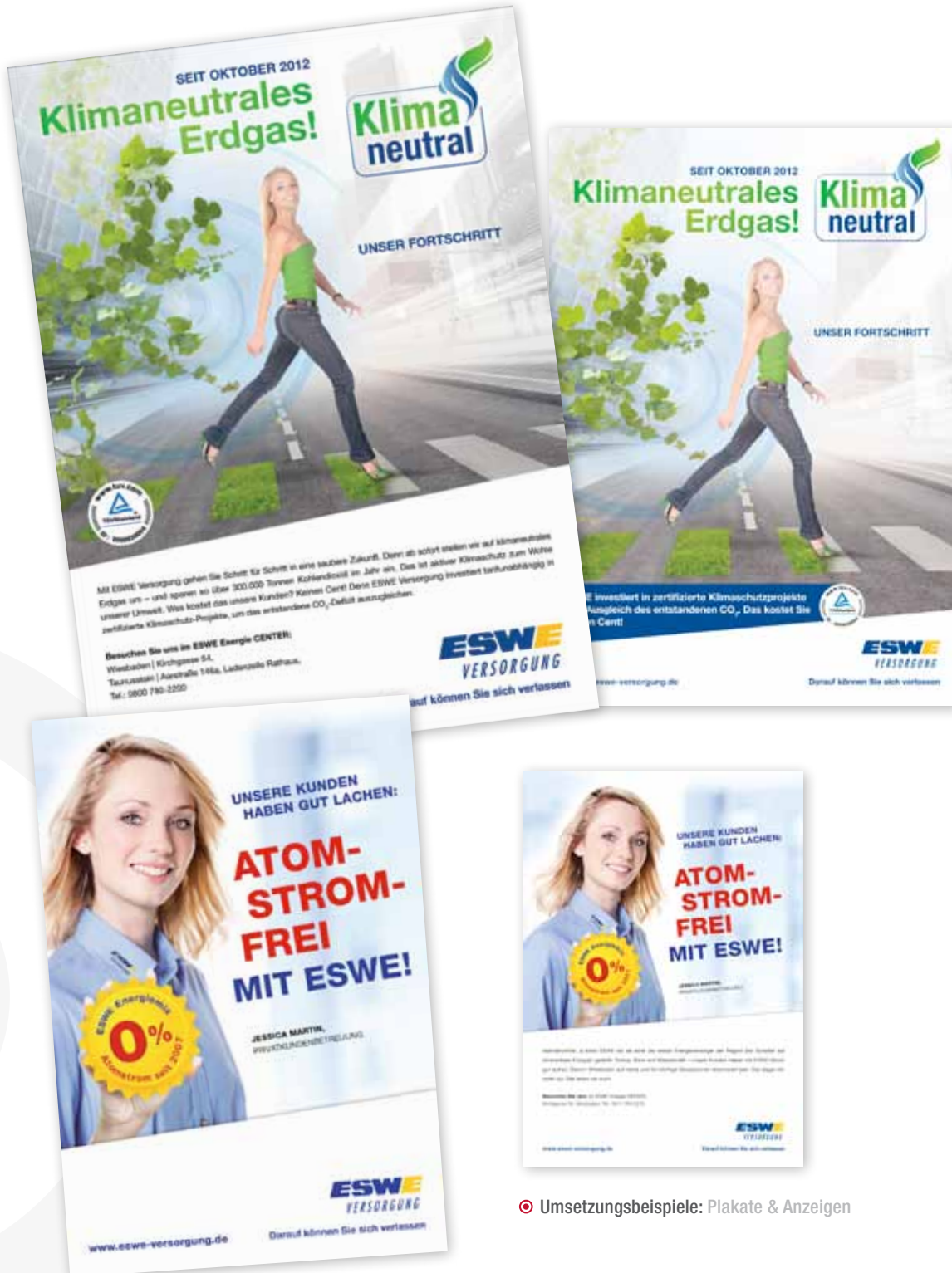
Umsetzungsbeispiele: Plakate & Anzeigen