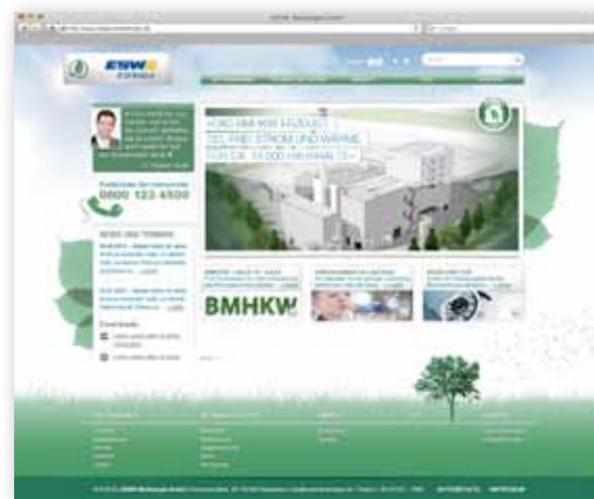
📍 Umsetzungsbeispiel: Internetauftritt ESWE Bioenergie GmbH