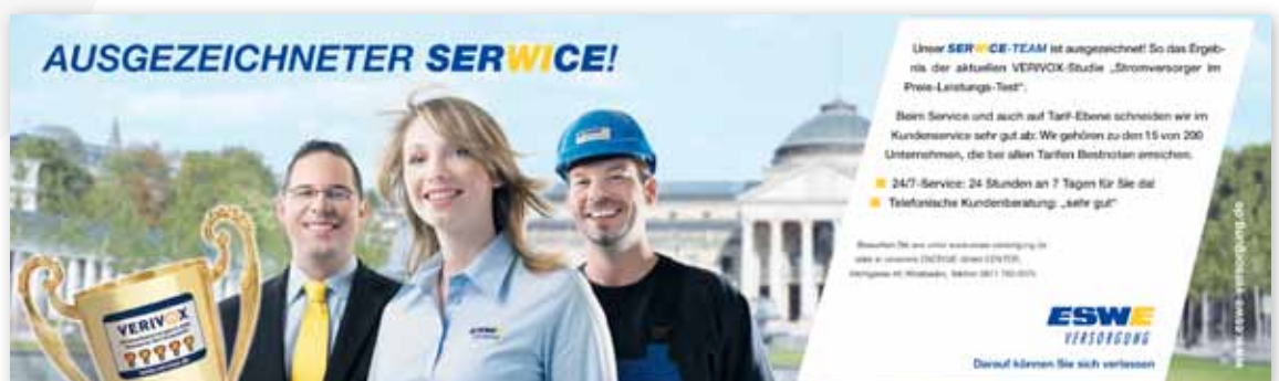
🎯 Umsetzungsbeispiel: Anzeigen