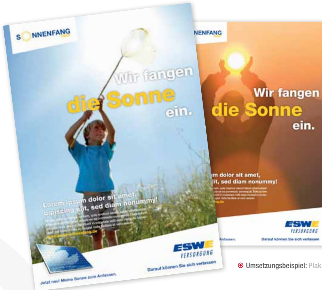
📍 Umsetzungsbeispiel: Plakate & Anzeigen