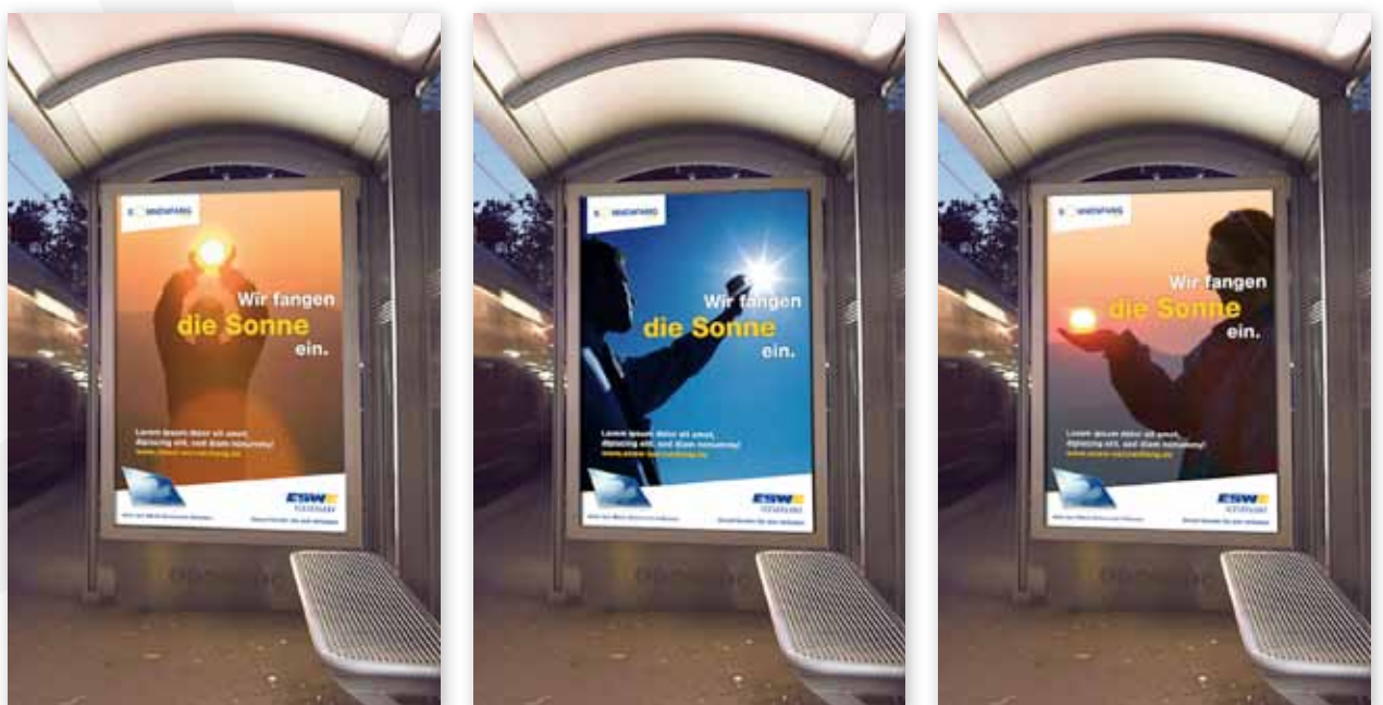
🎯 Umsetzungsbeispiel: Plakate & Anzeigen-Konzept Solarstrom