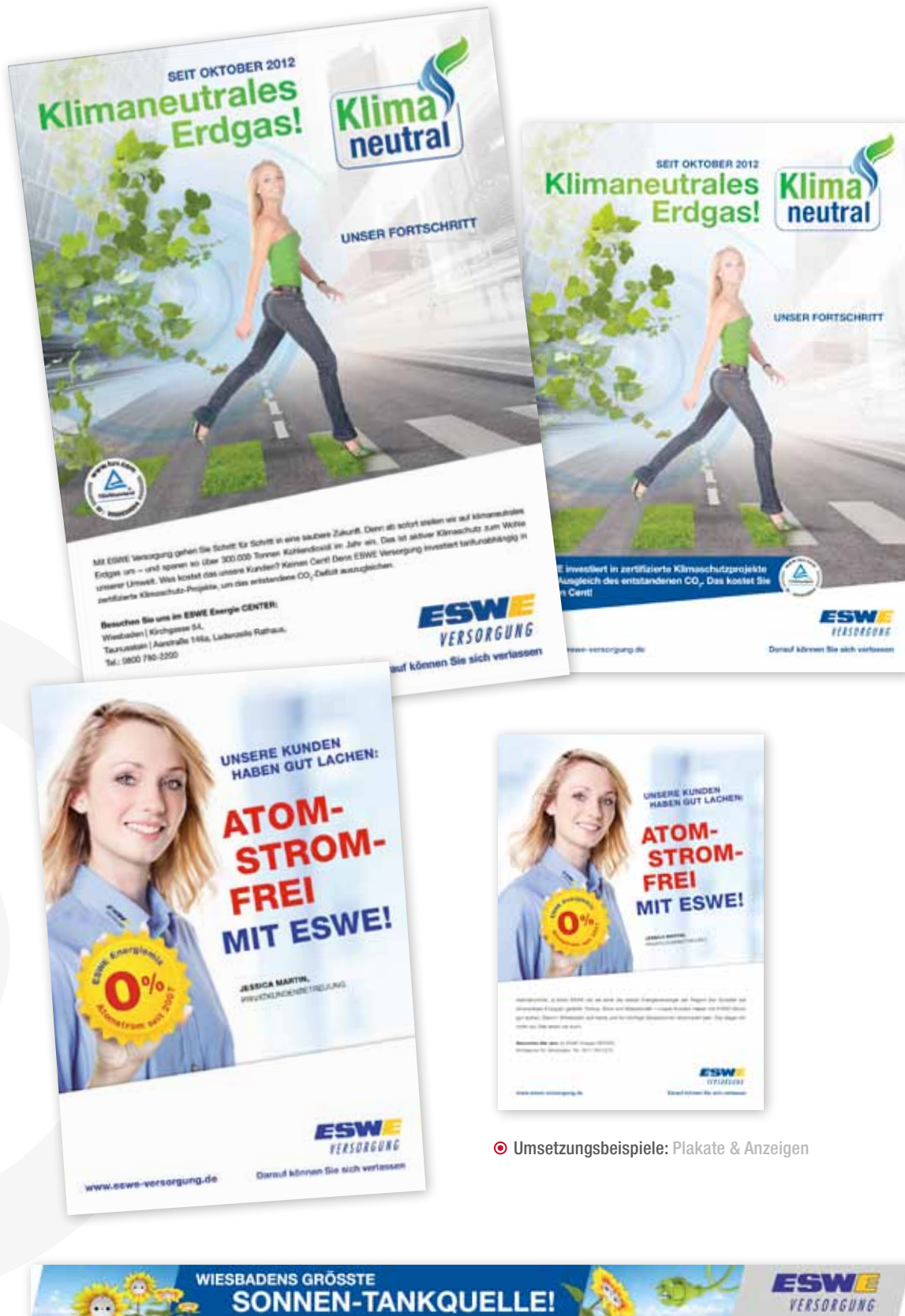
Umsetzungsbeispiele: Plakate & Anzeigen